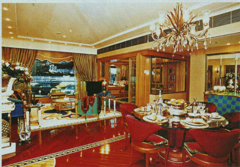
新地的禮頓山，樓書清楚仔細，質料更落足本錢。