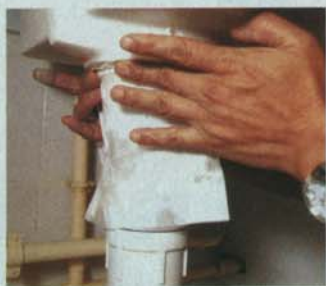
▲以紙巾輕放在水喉旁，漏水即時遁形。