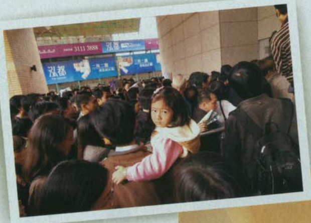
▲泓都去年開售時，未有示範單位，已人山人海搶買樓。