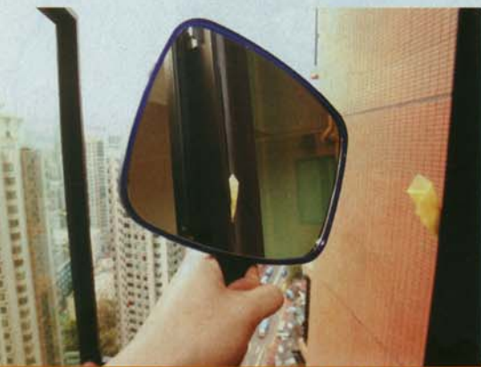
▲可以一面鏡子，看窗外的防水膠是否有縫。

除了這兩大高危的地方，詹濟南還發現廁所門後的毛巾架垂直掛在牆邊，因為右邊沒有上螺絲，甚至連膠塞都沒有。此外，廚房的抽氣扇亦裝得不夠實，可上下搖晃，「這個業主真的看得很不小心。」詹濟南不禁搖頭歎道。