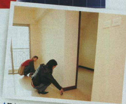
▲陳小姐(右)收樓後，對單位用料大失所望，希望盡快賣出單位。

殊不知上月收樓時才大失所望，「用料好差，發展商提供的電器亦是不知名的牌子，除了景觀，簡直一無是處。」陳小姐勞氣地說。泓都的樓書並沒有清楚列明用甚麼建築材料，只表示牆身用高級乳膠漆；地台用高級高溫磚及窗台鋪天然石面板等，十