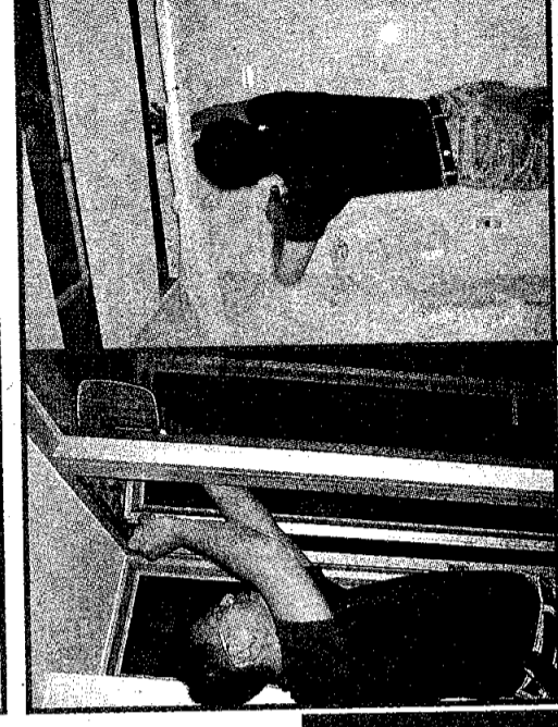
鋁窗邊漏腳防水膠，如不修復，有機會滲水。