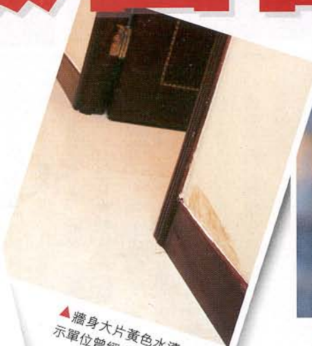
▲牆身大片黃色水漬，顯示單位曾經水漬。