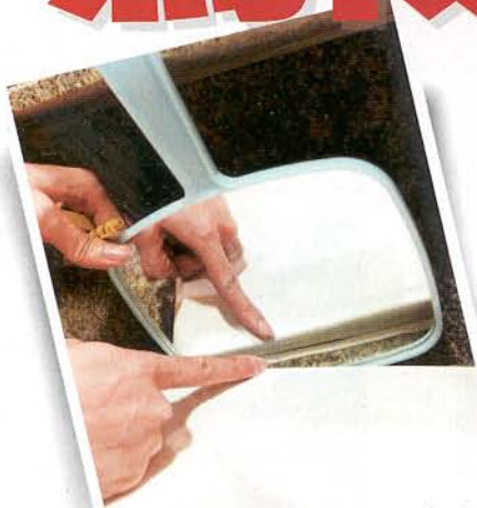
▲洗手盆的虛位，「照妖鏡」一出，便無所遁形。