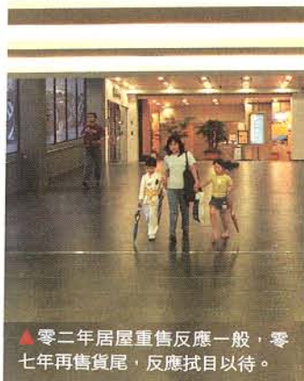
▲零二年居屋重售反應一般，零七年再售貨尾，反應拭目以待。

事實上，今年成交最多的居屋，如麗晶花園、兆康苑、穗禾苑、康華苑、龍蟠苑及翠竹花園等，都有相同特徵。除了坐落市區，樓齡還需超過十年以上，更要有大部分單位已補地價。零七年居屋重售時，若要炒得起，相信房委會要再續領匯作風，賤賣資產還富於民了。 [END]